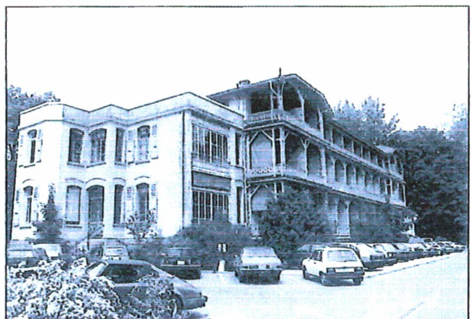
La Clinique Générale en 1987

La Clinique qu'il ouvre est certainement la plus moderne de Suisse et comprend 20 lits répartis en 2 dortoirs de 4 malades chacun et 12 chambres à 1 lit dont plusieurs avec cabinet de toilette, salle de bains et chambrette adjacente pour la garde privée. Le deuxième étage comprenait le service opératoire avec deux salles d'opérations, l'une septique et l'autre aseptique, une salle de gynécologie et d'endoscopie, le local de stérilisation, une chambre de narcose et une autre de réveil. A l'époque le personnel soignant que ce soit les médecins et les infirmières dormaient dans la Maison. Seuls le Docteur Reverdin et son premier adjoint ne logeaient pas dans la Clinique. La Clinique possédait également un ascenseur qui, chose inconnue à l'époque à Genève, fonctionnait au moyen d'un courant électrique