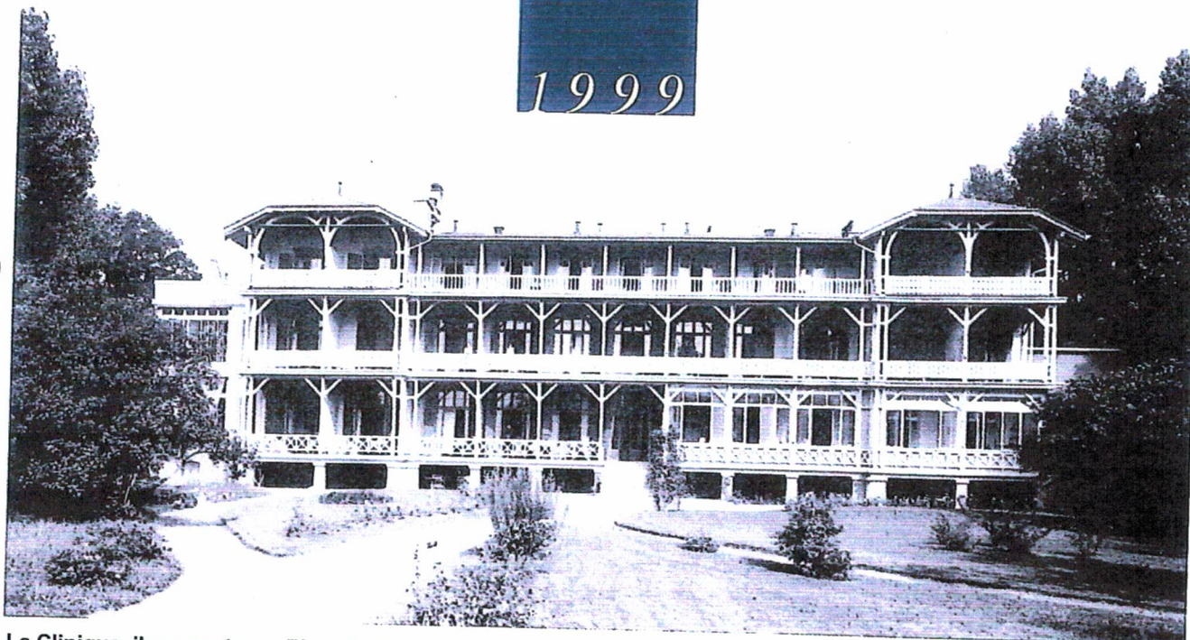
La Clinique, il y a cent ans, Photo P. George, Genève